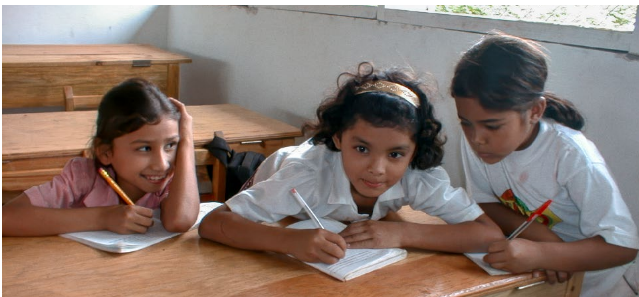
Tres estudiantes trabajando en un aula proporcionada por el proyecto Solar.net Village.

Esta fragilidad estatal se traduce directamente en lo que Edwards et al. (2022) identifica como la falta de capacidad, competencia o voluntad por parte del Estado para alcanzar los objetivos colectivos. Otros académicos han documentado patrones similares de debilidad institucional en Honduras y, más ampliamente, en Centroamérica. Ruhl (2010) analiza cómo Honduras se desmoronó institucionalmente durante la crisis de 2009, mientras que Pearce (2010) sitúa a Honduras dentro de patrones más amplios de estatalidad limitada en Centroamérica, donde las instituciones estatales, en lugar de fortalecer el orden democrática, lo socavan de manera sistemática.