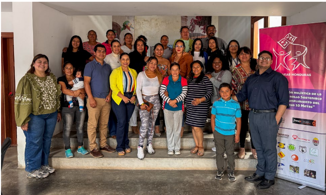
Miembros del Foro Dakar Honduras en una reunión de trabajo sobre el Objetivo de Desarrollo Sostenible n.º 4 de las Naciones Unidas, según el cual todas las niñas y todos los niños deben poder completar una educación gratuita, equitativa y de calidad.

La FDH es un buen ejemplo de este tipo de trabajo a través de su seguimiento especializado la justicia fiscal educativa, que permitirá al Ministerio de Educación contar con los recursos necesarios para asegurar el derecho a la educación (FDH 2023). Su proyecto “Raising the voice of free public education in Honduras” (2020-2026) inaugurado con el apoyo financiero y técnico de la OSC especializada en educación Educación en Voz Alta (parte de la Alianza Mundial por la Educación y gestionado por Oxfam Dinamarca), tiene como objetivo central exigir un mayor financiamiento público educativo, presupuestos sensibles al género y mayor transparencia (Education Out Loud 2025).