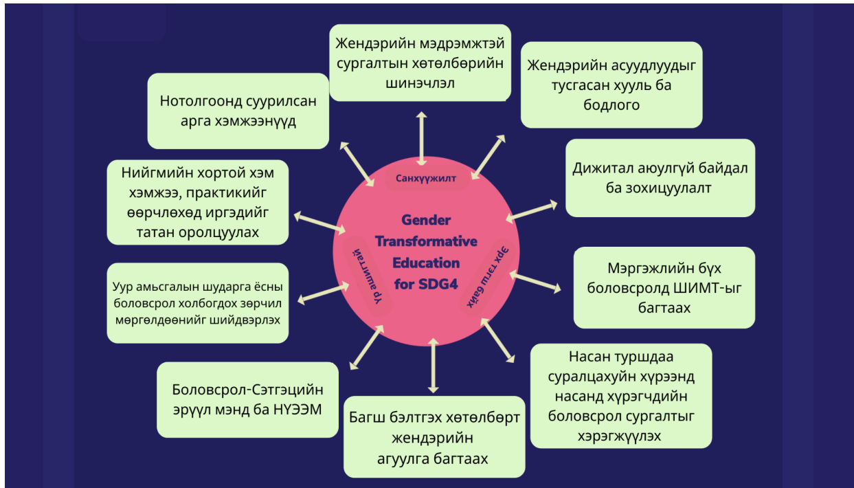
Эх сурвалж: Ази-Номхон далайн бүс нутаг дахь Жендэрийн хувирган өөрчлөх боловсролын төлөөх бүсийн тунхаглал (2025)

Боловсролын салбарт болон боловсролоор дамжуулан жендэрийн эрх тэгш байдлыг хангах нь хүний эрхийн хөтөлбөрүүдийн гол цөм бөгөөд 2030 он хүртэлх Тогтвортой хөгжлийн зорилтуудад хүрэх арга зам. НҮБ боловсрол эзэмших хийгээд насан туршийн суралцахуйн эрх нь хэнийг ч