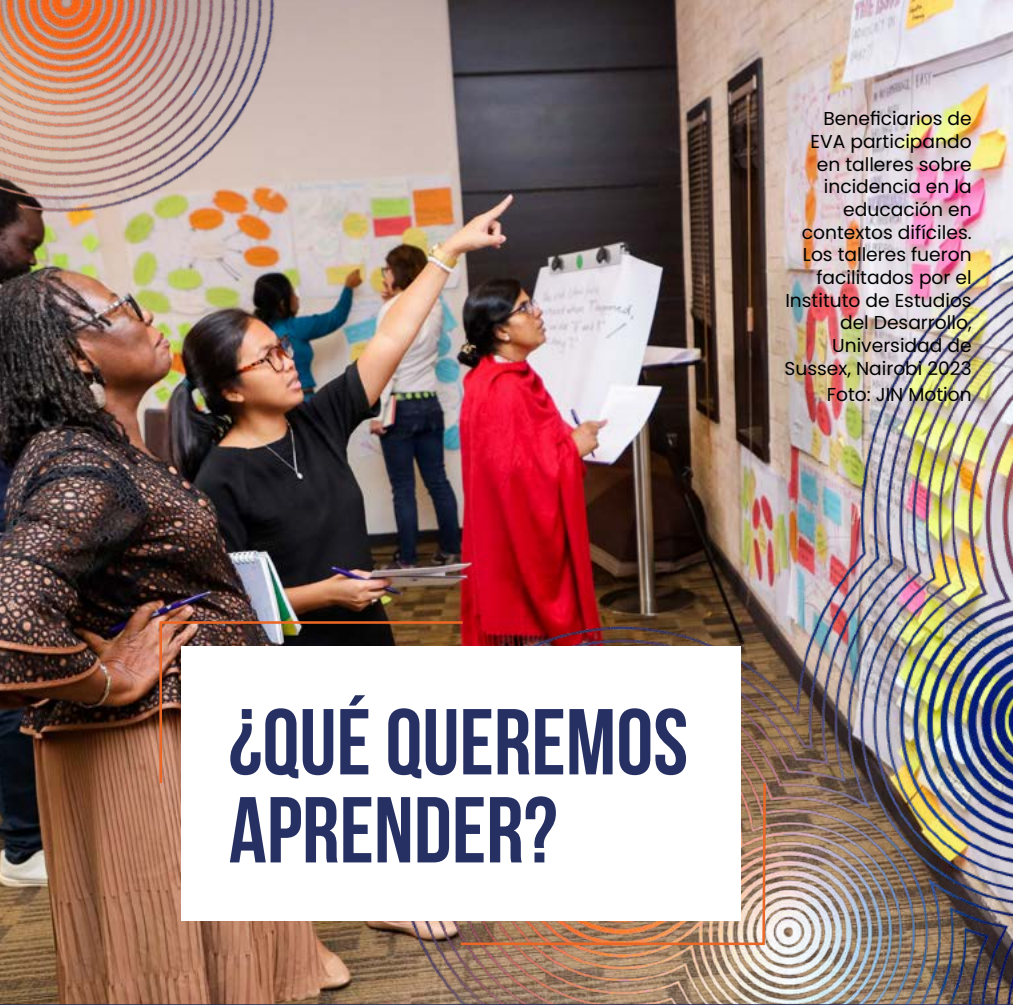
Beneficiarios de EVA participando en talleres sobre incidencia en la educación en contextos difíciles. Los talleres fueron facilitados por el Instituto de Estudios del Desarrollo, Universidad de Sussex, Nairobi 2023.